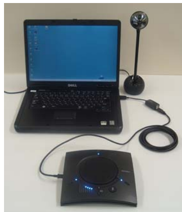
PCとの接続イメージ