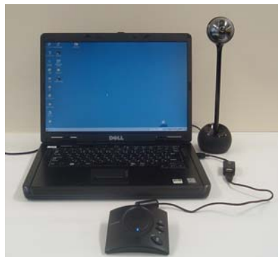
PCとの接続イメージ